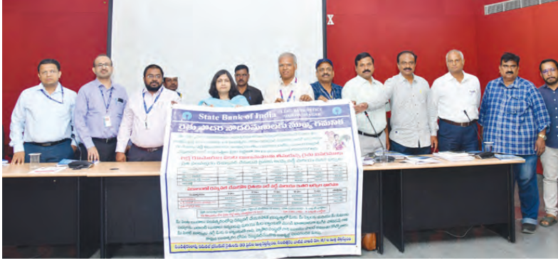
వార్షిక రుణ ప్రణాళికను విడుదల చేస్తున్న కలెక్టర్ విజయేంద్ర బోయి

మహబూబ్ నగర్ బ్యూరో, మే 14 ప్రభాతవార్త: బ్యాంకర్ల ప్రజలకు అందించే రుణాల్లో నిర్దేశించబడిన లక్ష్యాలను సకాలంలో చేరుకోవాలని జిల్లా కలెక్టర్ విజయేంద్ర బోయి ఆనాడు. బుధవారం సమీకృత కలెక్టరేట్ సమావేశ మందిరంలో 202425 ఆర్థిక సంవత్సరంలో జరిగిన ప్రగతిపై బ్యాంకర్ల ద్వారా డి.ఎల్.డి.ఎల్.ఎల్.ఎల్. సమీక్షా సమావేశం నిర్వహించారు. ఈ సందర్భంగా ఆమె మాట్లాడుతూ 202425 ఆర్థిక సంవత్సరంలో 2025 మార్చి 31 ముగింపు నాటికి జిల్లా వార్షిక రుణ ప్రణాళిక లో 8390.57 కోట్ల రుణ లక్ష్యం కు గాను 7223.68 కోట్ల రుణాలను మంజూరు చేసి 86.10 శాతం సాధించినట్లు తెలిపారు. ఇందులో భాగంగా వ్యవసాయం మరియు వ్యవసాయ అనుబంధ రంగాలకు గాను రూ. 3512