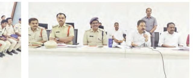
సమావేశంలో మాట్లాడుతున్న జిల్లా ఎన్టీ