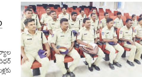
అవగాహన కార్యక్రమానికి హాజరైన జిల్లా పోలీస్ యంత్రాంగం