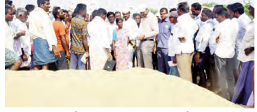
రైతులతో మాట్లాడుతున్న కలెక్టర్ సంతోష్

గద్వాల, మే 14, ప్రభాతవార్త: వరిధాన్యం కొనుగోలు చేసిన వెంటనే కేంద్రాల్లో నిల్వ చేయకుండా సంబంధిత మిల్లకు వెంటనే తరలించాల్సిందిగా జిల్లా కలెక్టర్ డి.యం.సంతోష్ అధికారులను ఆదేశించారు. బుధవారం ధరూర్ మండలంలోని ధరూర్, అల్పాలపాడు గ్రామంలోని ఐ.కే.పీ ఆధ్వర్యంలో నిర్వహిస్తున్న వరి ధాన్యం కొనుగోలు కేంద్రాన్ని అడ్డంకు కలెక్టర్ నర్సిం గ రావుతో కలిసి జిల్లా కలెక్టర్ పరిశీలించారు. ఈ సందర్భంగా జిల్లా కలెక్టర్ ధాన్యం కొనుగోలు కేంద్రం వద్ద రైతులు అరబోనిన ధాన్యాన్ని పరిశీలించి, ఇప్పటివరకు ఎంత పరిమాణంలో ధాన్యం సేకరించారు, రైస్ మిల్లులకు ఎంత ధాన్యం తరలించారు తదితర వివరాలను అడిగి తెలుసుకున్నారు. కొనుగోలు కేంద్రానికి సంబంధించిన రికార్డులను తనిఖీ చేశారు. స్వయంగా డి.జి.బి.ల తేమ మీటర్ ద్వారా ధాన్యం తేమ శాతాన్ని పరిశీలించి, కొనుగోలు కేంద్రాలకు వచ్చే ధాన్యం 17 తేమ శాతం రాగానే కాంటా వేసి మద్దతు ధరకు కొనుగోలు చేసి సంబంధిత మిల్లులకు తరలించాలని అన్నారు. గన్నీ బ్యాగుల కొరత తలెత్తకుండా రవాణా కోసం లారీలను తగిన సంఖ్యలో నిర్దేశించాలని సూచించారు. ధాన్యం కొనుగోలు చేసిన తర్వాత వెంటనే ట్యాబు ఎంపిలీ పూర్తి చేసి, రెండు రోజుల్లోనే రైతుల ఖాతాల్లో డబ్బులు జమ చేసేలా చర్యలు తీసుకోవాలని ఏపీఎస్ కు సూచించారు. ధాన్యం కొనుగోలు ప్రక్రియకు సంబంధించి అన్ని వివరాలు రిజిస్ట్రార్లో పక్కాగా నమోదు చేయాలని ఆదేశించారు. వరి ధాన్యం కొనుగోలు కేంద్రాల్లో అన్ని సౌకర్యాలు ఉండాలని, రైతులకు ఎలాంటి ఇబ్బందులు కలగకుండా చర్యలు తీసుకోవాలని అధికారులను ఆదేశించారు. ఈ కార్యక్రమంలో జిల్లా పౌరసరఫరాల అధికారి స్వామి కుమార్, సివిల్ సప్లయ డివిజన్ డి.వి.ఎ. మి.ఎ.ల, ధరూర్ తహసీల్దార్ భూపాల్ రెడ్డి, సంబంధిత అధికారులు, రైతులు పాల్గొన్నారు.