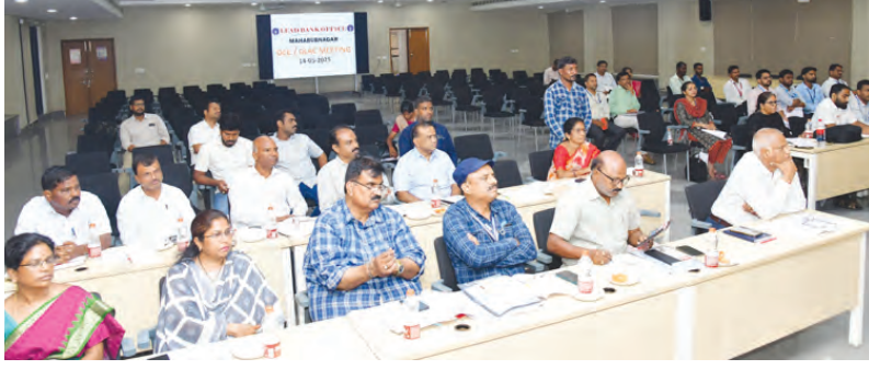
సమావేశంలో పాల్గొన్న అధికారులు