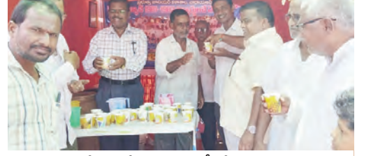
చలివెంట్లో మజ్జిగ పంపిణీ చేస్తున్న దృశ్యం