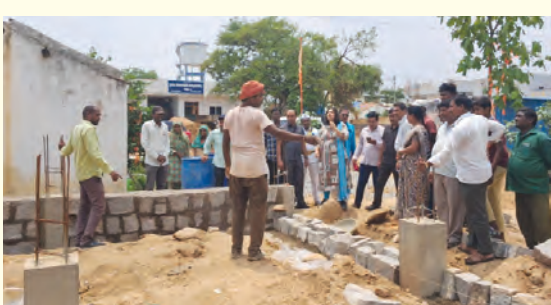
ఇందిరమ్మ ఇళ్ల నిర్మాణాలను పరిశీలిస్తున్న కలెక్టర్

నవాపేట, 14 మే, ప్రభాతవార్త : ఇందిరమ్మ ఇళ్ల నిర్మాణ పనులను వేగవంతం చేయాలని జిల్లా కలెక్టర్ విజయేంద్ర బోయి పేర్కొన్నారు. బుధవారం మండలంలోని దేవల్లి గ్రామంలో చేపట్టిన ఇందిరమ్మ ఇళ్ల నిర్మాణ పనులను పరిశీలించారు. ఈ సందర్భంగా కలెక్టర్ మాట్లాడుతూ ఇందిరమ్మ ఇళ్ల నిర్మాణంలో అర్హులైన లబ్ధిదారుల జాబితాను రూపొందించాలని, జాబితాలో అర్హులు మాత్రమే ఉండాలని అధికారులను ఆదేశించారు. ప్రజాతో మాట్లాడి గ్రామంలో నెలకొన్న నీటిసమస్య వివరాలను అడిగి తెలుసుకుని పరిష్కరించే విధంగా చర్యలు తీసుకోవాలన్నారు. ఆనంతరం వోడూరు గ్రామంలోని వరి ధాన్యం కొనుగోలు కేంద్రాన్ని సందర్శించారు. రైతులకు నీడ, తాగునీరు, ఓఆర్ఎస్ ప్యాకెట్లు అందుబాటులో ఉండాలని నిర్వాహకులను ఆదేశించారు. ఈ సందర్భంగా ఆమె కొనుగోలు కేంద్రం ద్వారా ఇంతవరకు కొనుగోలు చేసిన ధాన్యం వివరాలు, రైన్ మిల్లులకు తరలింపిన వివరాలు, మేము ధర చెల్లించిన వివరాలు మొదలగు అంశాలను అడిగి తెలుసుకున్నారు. కొనుగోలు కేంద్రానికి సంబంధించిన రిపోర్టులను తనిఖీ చేశారు. లారీలు సమన్వయం చేయాలని, రైన్ మిల్లులకు తరలింపిన వివరాలు, మేము ధర చెల్లించిన వివరాలు మొదలగు అంశాలను అడిగి తెలుసుకున్నారు. కొనుగోలు కేంద్రానికి సంబంధించిన రిపోర్టులను తనిఖీ చేశారు. లారీలు సమన్వయం చేయాలని, రైన్ మిల్లులకు తరలింపిన వివరాలు, మేము ధర చెల్లించిన వివరాలు మొదలగు అంశాలను అడిగి తెలుసుకున్నారు. కొనుగోలు కేంద్రానికి సంబంధించిన రిపోర్టులను తనిఖీ చేశారు. లారీలు సమన్వయం చేయాలని, రైన్ మిల్లులకు తరలింపిన వివరాలు, మేము ధర చెల్లించిన వివరాలు మొదలగు అంశాలను అడిగి తెలుసుకున్నారు.