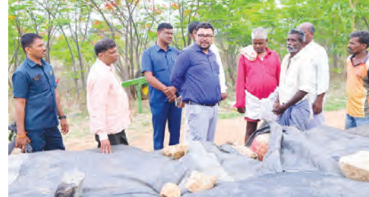
రైతులతో మాట్లాడుతున్న జిల్లా కలెక్టర్ బాదాపతి సంతోష్

నాగర్ కర్నూల్ ప్రతినిధి, మే 14 ప్రభాతవార్త: కొనుగోలు కేంద్రాల ద్వారా పరిధాన్యం సేకరణలో జాప్యానికి తావులేకుండా ప్రణాళికాబద్ధంగా చర్యలు చేపట్టాలని నాగర్ కర్నూల్ జిల్లా కలెక్టర్ బాదాపతి సంతోష్ అధికారులకు సూచించారు. బుధవారం నాగర్ కర్నూల్ మండలం వనపర్తి గ్రామంలో ధాన్యం కొనుగోలు కేంద్రాన్ని జిల్లా కలెక్టర్ ఆకస్మికంగా తనిఖీ చేశారు. ధాన్యం కొనుగోలు ప్రక్రియ సజావుగా ప్రారంభమైందని సంబంధిత అధికారులు కేంద్రాల వద్ద క్షేత్రస్థాయిలో అందుబాటులో ఉంటూ ధాన్యం సేకరణను నిశితంగా పర్యవేక్షణ చేయాలని ఆదేశించారు. రైతులు తరలివిన ధాన్యం