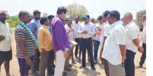
అక్షకూరులో వరి ధాన్యం కొనుగోలు కేంద్రంలో రైతులతో మాట్లాడుతున్న అదనపు కలెక్టర్ వెంకటేశ్వర్లు

అక్షకూరు, మే 14, ప్రభాతవార్త: రాష్ట్ర ప్రభుత్వం రైతులకు అత్యంత ప్రాధాన్యత ఇస్తున్న విజయాన్ని గుర్తించి రైతులకు మిల్లర్ల వరి ధాన్యం కొనుగోలు కేంద్రాల యజమానులు నిష్పక్ష పాతంగా వ్యవహరించాలని ఆరాకానిపర్తి రైతులను ఇబ్బందులకు గురి చేస్తే కఠిన చర్యలు గురికావాలి వస్తుందని జిల్లా అడివనల్ కలెక్టర్ వెంకటేశ్వర్లు పేర్కొన్నారు. బుధవారం రోజు అక్షకూరు మండలంలోని వరి ధాన్యం కొనుగోలు కేంద్రాలను పరిశీలించిన అనంతరం ఆయన పలు విషయాలపై మాట్లాడారు. ఈ సందర్భంగా అదనపు కలెక్టర్ మాట్లాడుతూ వరి ధాన్యం కొనుగోలు కేంద్రాలలో రైతులకు ఎలాంటి ఇబ్బంది కలిగించకుండా గిన్నె బ్యాగులు తదితర వాటిపై జిల్లా ఉన్నత అధికారులు ఎప్పటికప్పుడు సమీక్షలు నిర్వహిస్తూనే రైతులకు అందగా నిలిచేందుకు అన్ని ఏర్పాట్లు చేసిన నేపథ్యంలో స్థానికంగా కూడా అధికారులు వరి ధాన్యం కొనుగోలు కేంద్రాల యజమానులు రైతులకు సంబంధించిన వరి ధాన్యాన్ని మొత్తం కొనుగోలు చేసే వరకు