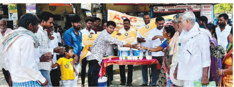
మజ్జిగను పంపిణీ చేస్తున్న దృశ్యం