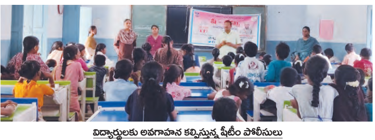
విద్యార్థులకు అవగాహన కల్పిస్తున్న ఓపీఓ పోలీసులు