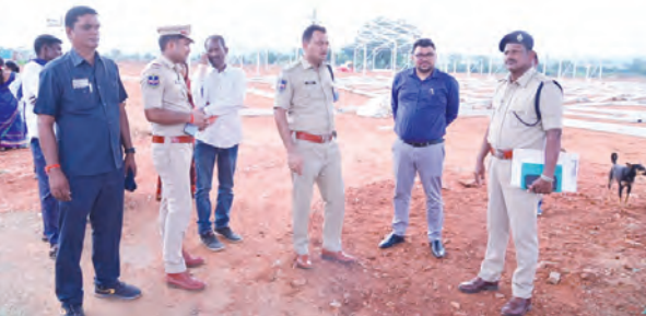
సభా ఏర్పాట్లను పరిశీలిస్తున్న జిల్లా కలెక్టర్, జిల్లా ఎస్సీ