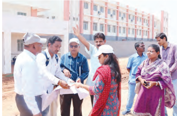
మెడికల్ కళాశాల నిర్మాణ వసుల పరిశీలిస్తున్న కలెక్టర్

నారాయణపేట టౌన్, మే 14 ప్రభాతవార్త : నారాయణపేట మండలంలోని అప్పకపల్లి సమీపంలో ఉన్న ప్రభుత్వ మెడికల్ కళాశాలను బుధవారం జిల్లా కలెక్టర్ సిక్రా పట్నాయక్ సందర్శించారు. మెడికల్ కళాశాల ఆవరణలో రూ. 26 కోట్ల వ్యయంతో నిర్మించబోయే నర్సింగ్ కళాశాల కోసం స్థలాన్ని, అలాగే రూ. 24 కోట్లతో నిర్మించే ఎంసీబీ మండల్ అండ్ చైల్డ్ హెల్త్ కేంద్రం సెంటర్ స్థలాన్ని కూడా కలెక్టర్ పరిశీలించారు. ఎంసీబీ, నర్సింగ్ కళాశాల నిర్మాణ వసులను వీలైనంత త్వరగా ప్రారంభించాలని డి.జి.ఎం ఎంసీబీ ఈ ఈ కార్యకర్తలను ఆదేశించారు. ఆనంతరం మెడికల్ కళాశాల, నర్సింగ్ కళాశాల తరగతి గదులకు వెళ్లి తరగతుల నిర్వహణను పర్యవేక్షించారు. నర్సింగ్ విద్యార్థులతో కలెక్టర్ మాట్లాడారు. నర్సింగ్ కళాశాలలో ఏమైనా సమస్యలు ఇబ్బందులు ఉన్నాయా? అని విద్యార్థులతో వాకబు చేశారు. కొందరు విద్యార్థిని భోజనం సరిగ్గా ఉండడం లేదని కలెక్టర్ దృష్టికి తీసుకురాగా స్పందించిన కలెక్టర్ వంట ఏజెన్సీ వాళ్లతో మాట్లాడి నాణ్యమైన, రుచికరమైన భోజనాన్ని విద్యార్థులకు అందించేలా చర్యలు తీసుకోవాలని కళాశాల ప్రిన్సిపాల్ ను సూచించారు. మిగతా జిల్లాలో పోలింగ్ జిల్లా అధ్యక్షునికే వసతులతో కళాశాల భవనం ఉందని, ప్రారంభంలో కొంత ఇబ్బందులు ఉండడం మామూలేనని, కానీ వాటిని అధిగమించేయకు అధికారులు కృషి